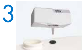
3 Insérez le tube et placez le Sanialarm sur le dessus.