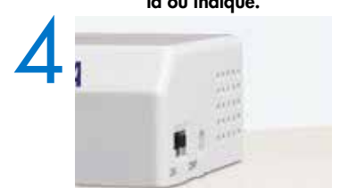
4 Mettez l'interrupteur sur la position ON.