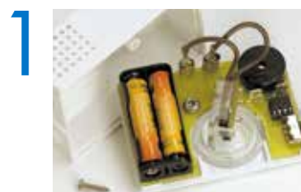
1 Installez deux piles AA (non incluses)

* Compatible avec Saniplus, Sanibest Pro, Sanipack, Sanigrind Pro et Sanivite