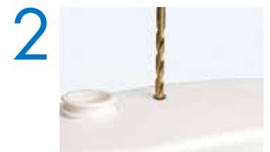
2 Percez un trou de 3/8 po de diamètre sur le dessus du boîtier là où indiqué.